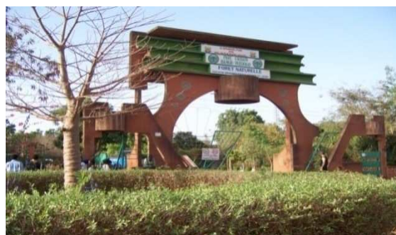
Parc urbain Bangr Weogo

Par ailleurs, les promoteurs pourraient aller vers les structures organisatrices de grandes rencontres afin de proposer aux visiteurs (participants) des produits touristiques de qualité et attrayants.