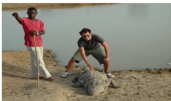
Mare aux crocodiles sacrés de Bazoulé

La 3 ème édition du Festival Bon Nané/Ouistiti les 3 et 4 janvier 2013 à Ouagadougou.