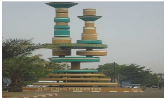
Place des cinéastes