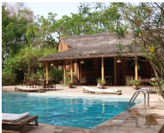
Réceptif touristique (région du centre)

Le 09 janvier 2013 : Lancement du projet pour l'assainissement de la cour royale de Tiébélé placée sous la présidence de Monsieur le Secrétaire Général du Ministère de la Culture et du Tourisme et en présence de la 2 ème conseillère de l'ambassade des Etats Unis d'Amérique au Burkina Faso. Ce projet vise à assainir l'environnement du site, afin de