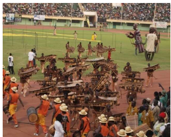
Cérémonie d'ouverture du FESPACO

Source du trimestre : base de données de la DGT; LEFASO.NET, Le Pays, RTB, Sidwaya