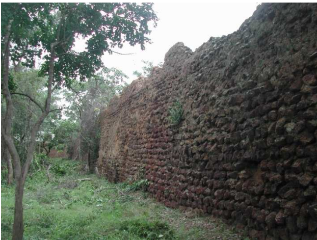
Aperçu des Ruines de Loropeni