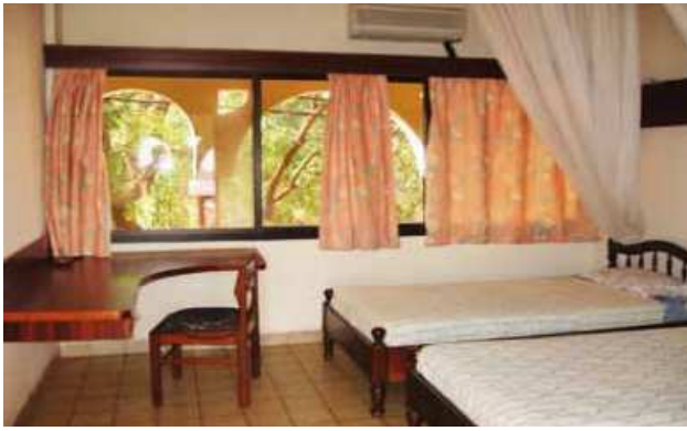
Confort hôtelier dans la région de l'Ouest

La Direction Générale du Tourisme a le plaisir de mettre à la disposition des acteurs du secteur le deuxième numéro du baromètre trimestriel du tourisme au Burkina Faso. La présente édition fait un zoom sur l'évolution du tourisme interne au Burkina Faso. Il montre également les tendances du secteur au cours du deuxième trimestre de l'année 2013 et dégage les perspectives pour le troisième trimestre.