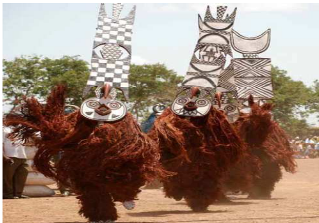
Danse de masques lors de la Semaine Nationale de la Culture à Bobo Dioulasso