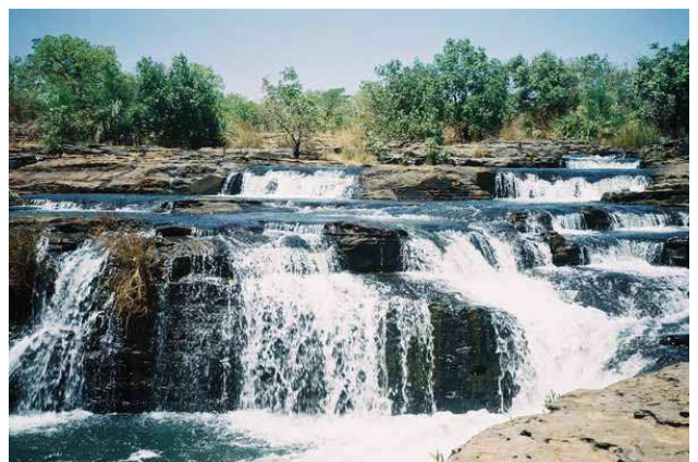
Cascades de karfiguela (Banfora)

Toujours dans la fièvre des vacances, les entreprises touristiques (agences de voyages et de tourisme, promoteurs d'ETH, concessionnaires et guides) dans une synergie d'actions pourraient proposer des produits touristiques (packages) adaptés à la demande nationale tels que des excursions, des colonies de vacances, des camps vacances/village ainsi que d'autres activités de loisirs et inciter les nationaux à la découverte des richesses touristiques du pays.