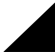
Tableau 4-6: Fréquentation du centre de documentation de l'IPN

Tableau 4-5: Evolution des indicateurs du CENALAC