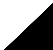
Tableau 8-4: Répartition annuelle des dépenses d'investissement accordées par l'Etat

Tableau 8.3: Répartition annuelle du Budget du MCT par direction (dépenses de fonctionnement en millions de FCFA)