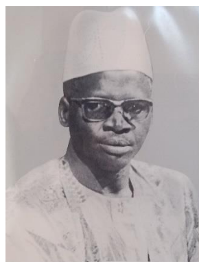
S.E.M. ALFRED KABORE 1976–1977 Ministre des Affaires Etrangères