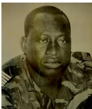
S.E.M. SEYE ZERBO 1974–1976 Ministre des Affaires Etrangères