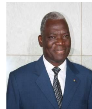
S.E.M. Bédializoun Moussa NEBIE 2015-2016 Ministre des Affaires étrangères et de la Coopération régionale