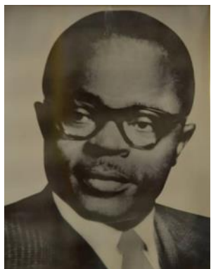
S.E.M. MAURICE YAMEOGO 1960