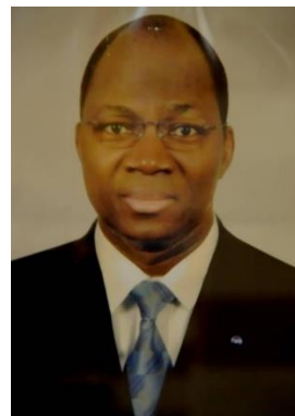
S.E.M. DJIBRILL YIPENE BASSOLE 2011–2014 Ministre des Affaires Etrangères de la Coopération Régionale