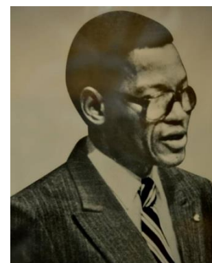
S.E.M. FELIX TEMENTARBOUM 1980–1982 Ministre des Affaires de la Coopération Régionale