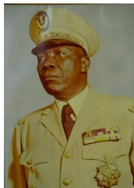
S.E.M. SANGOULE LAMIZANA 1966–1967 Ministre des Affaires Etrangères