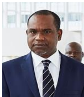
S.E.M. ALPHA BARRY 2016 –2021 Ministre des Affaires de la Coopération et des Burkinabé de l'Extérieur Ministre des Affaires Etrangères et de la Coopération