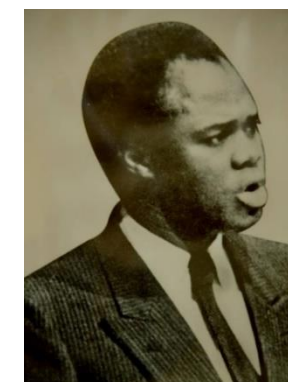
S.E.M. MICHEL KAFANDO 1982–1983 Ministre des Affaires de la Coopération Régionale