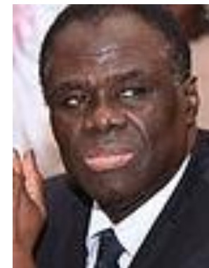
S.E.M. MICHEL KAFANDO 2014 –2015 Ministre des Affaires Etrangères de la Coopération Régionale