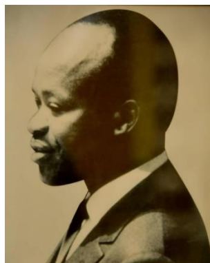
S.E.M. LOMPOLO KONE 1961–1966 Ministre des Affaires Etrangères