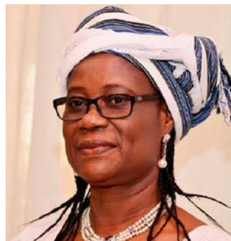
S.E.M. HADIZATOU ROSINE SORI-COULIBALY 2021 –2022 Ministre des Affaires Etrangères de la Coopération de l'Intégration africaine et des Burkinabè de l'Extérieur