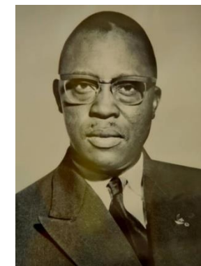
S.E.M. JOSEPH CONOMBO 1971–1974 Ministre des Affaires Etrangères