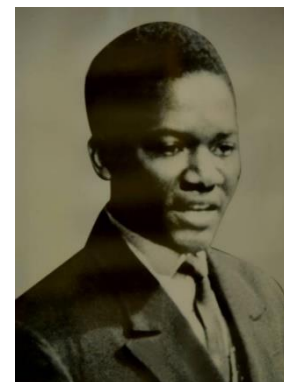
S.E.M. MALICK ZOROME 1967–1971 Ministre des Affaires Etrangères