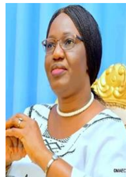
S.E.M. OLIVIA RAGNAGHNEWENDE ROUAMBA Depuis MARS 2022 Ministre des Affaires Etrangères de la Coopération Regionale et des Burkinabè de l'Extérieur