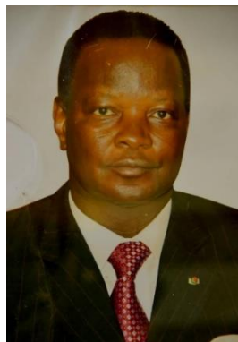
S.E.M. ALAIN BEDOUMA YODO 2008 –2011 Ministre des Affaires Etrangères de la Coopération Régionale