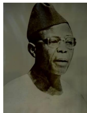
S.E.M. MOUSSA KARGOUGOU 1977–1980 Ministre des Affaires Etrangères